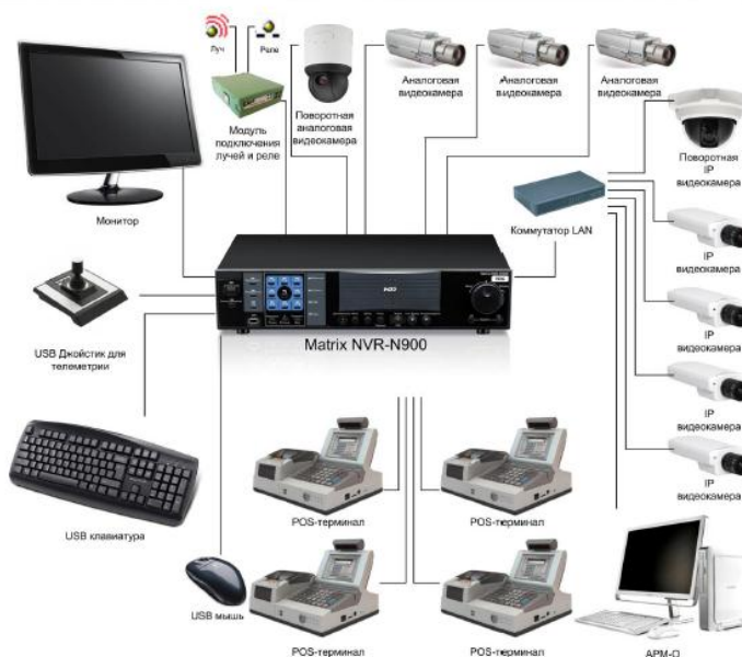
Схема локальной системы видеонаблюдения